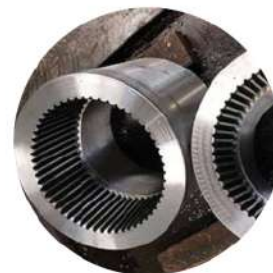
Кольца (зубчатые и др.)