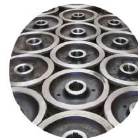
Крановые колеса, ролики и другие поверхности