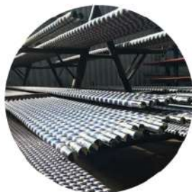
Цилиндрические поверхности штоков, шпинделей, втулок