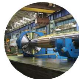
Гребные валы морских и речных судов