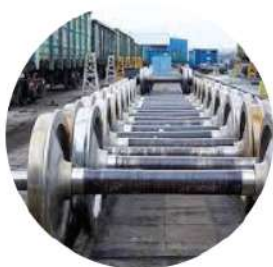
Колесные пары железнодорожных составов