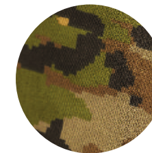
Оборонно- промышленный комплекс